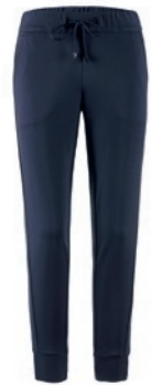
300 marine / navy