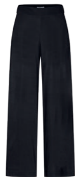
900 schwarz / black