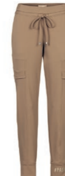
5616 tiger's eye