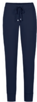
301 marine / navy