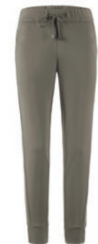
4310 laurel oak