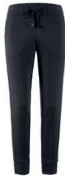
900 schwarz / black