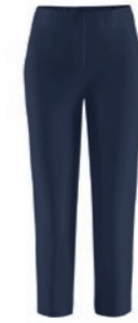
301 marine / navy