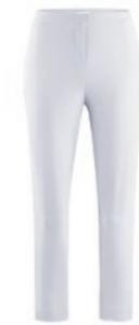
100 weiß / white