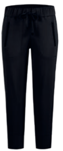
900 schwarz / black