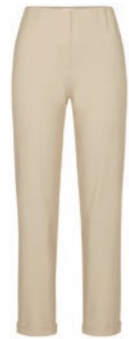
124 kalk / chalk