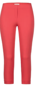
2033 poppy red