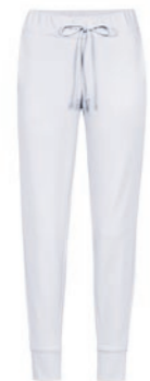
100 weiß / white