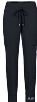
900 schwarz / black