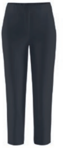
900 schwarz / black