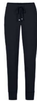
900 schwarz / black