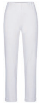
100 weiß / white