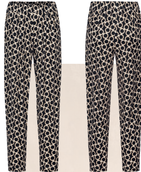
012P schwarz / black