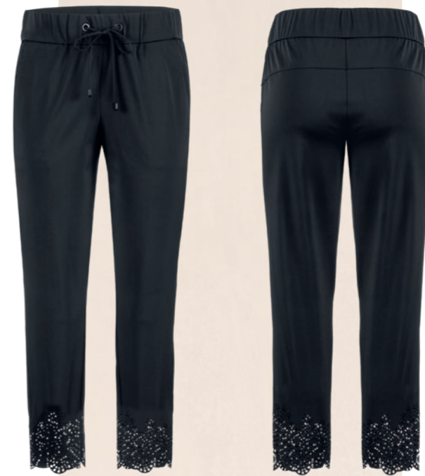
900 schwarz / black