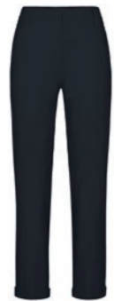
900 schwarz / black

SPORTY CASUAL - BASIC PANTS FOR THE WHOLE DAY